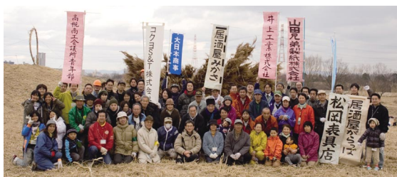
2010年の鶺鴒ヨシ原のヨシ刈りボランティア活動